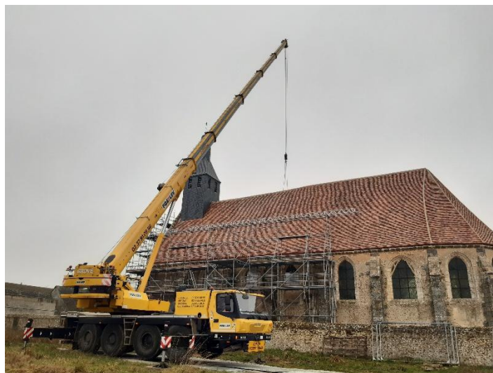
Démontage de l'échafaudage en février 2025 par l'entreprise Restauration Patrimoine Lagarde

Le dossier avait été lancé dès septembre 2019 par la précédente municipalité avec le choix du maître d'œuvre, à savoir François Sémichon, architecte et la demande d'un diagnostic pour faire un premier état des lieux des travaux de restauration nécessaires.